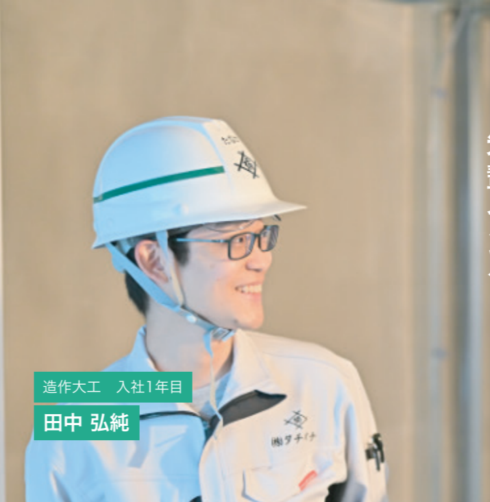
造作大工 入社1年目