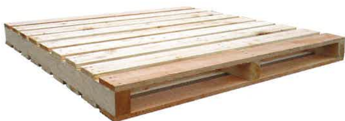
二方差しパレット

比較的構造が単純なため堅牢で耐久性に優れ、倉庫での保管用やトラック・鉄道・船舶など各種輸送機関に幅広く使われています。