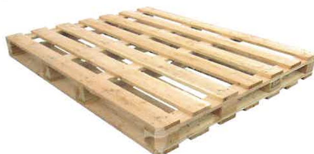
四方差しパレット

比較的構造が単純なため堅牢で耐久性に優れ、倉庫での保管用やトラック・鉄道・船舶など各種輸送機関に幅広く使われています。