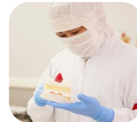
【製造職】 洋菓子の製造 および製造ライン管理