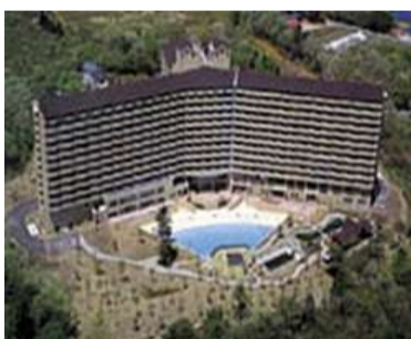
ロワジール那須高原