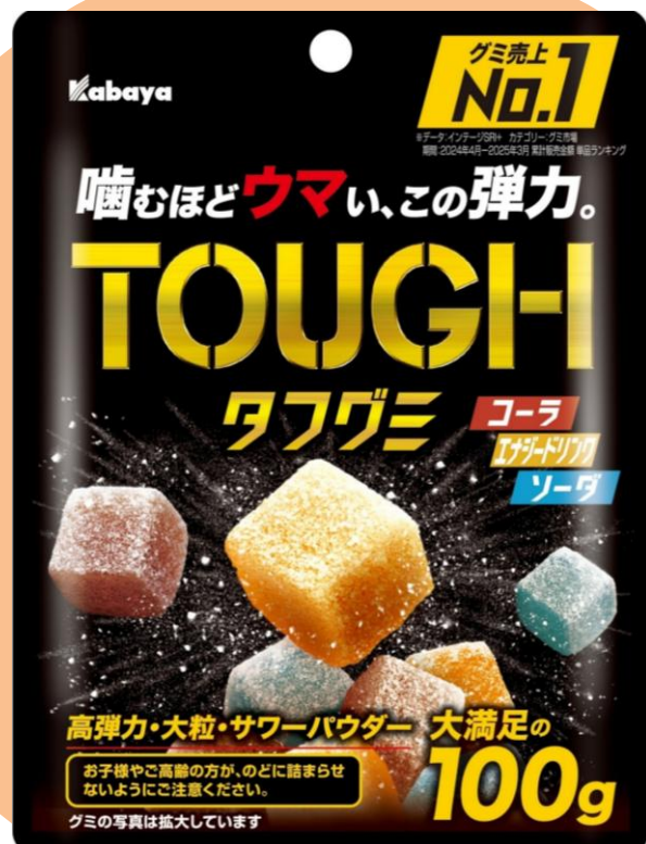
グミ売上No.1 集中したいときに食べたいグミNo.1