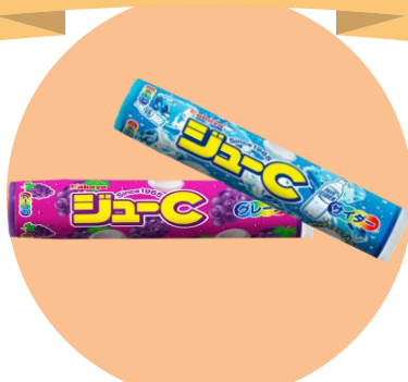
清涼菓子 「ジュウ-C」発売