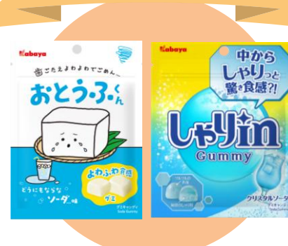
「しゃりいん」発売 「おとうふくん」発売