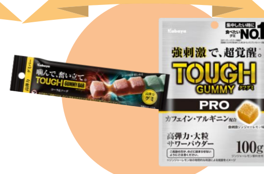
「タフグミ PRO」発売 「タフグミ BAR」発売