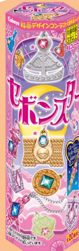
日経トレンディ「2025年ヒット商品ベスト30」 総合第4位「平成女児売れ」代表的商品として選出 同2025年業界別ヒット菓子部門大賞