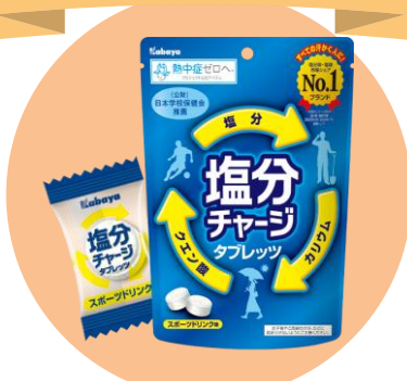
清涼菓子 「塩分チャージタブレット」発売