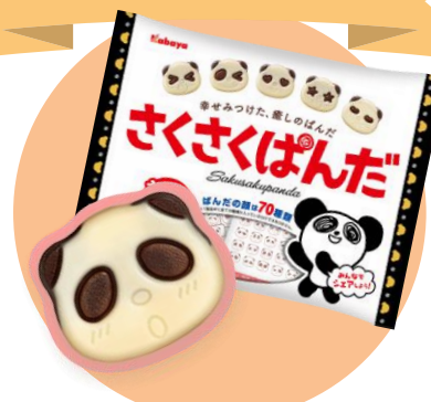
チョコレートビスケット 「さくさくぱんだ」発売