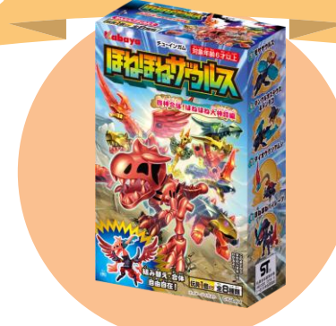
玩具菓子 「ほねほねザウルス」発売