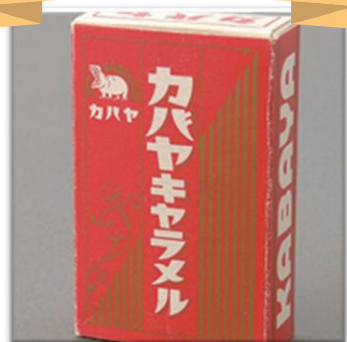
カバヤ食品 創業 「カバヤキャラメル」発売 ※現在は終売