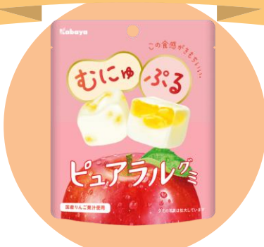
「ピュアラールグミ」発売