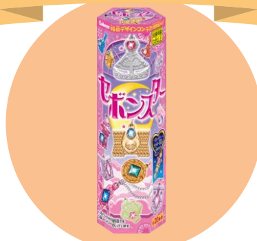
玩具菓子 「セボンスター」発売