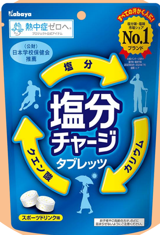
塩分味・塩味市場シェア 4年連続No.1