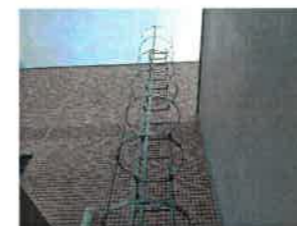
各種金属製品の製作

ステンレス、アルミ、スチールパネル、手摺、タラップ、鉄骨階段、家具金物、看板、架台…etc 建築金物、その他様々な金属製品の製作をしています。