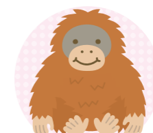
Dさん 品質保証部 グループリーダー

仕事内容：客先クレームは正対応と社内不具合は正と改善対応 勤続年数：36年 資格：フォークリフト 出身校：馬頭高校 趣味：利き酒 性格：負けず嫌いな