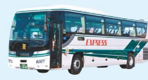
中距離高速バス 高速道路を利用し都市圏へ運行する高速(路線)バス

観光バス 観光バスは、豊富な種類のバスを取り揃えており、お客さまの様々なニーズにお応えいたします。