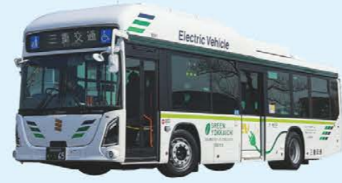
電気 (EV) バス 排出ガスゼロ、最後部席まで床段差のないフルノンステップEV路線バス