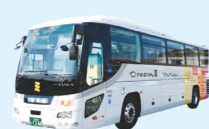
DREAM II ゆったりとした室内、多彩な仕様により、快適なご旅行をサポートパウダールーム付

観光バス 観光バスは、豊富な種類のバスを取り揃えており、お客さまの様々なニーズにお応えいたします。