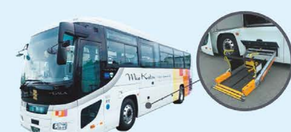
SUPER GRAND UD 車椅子乗降用リフトで安心快適なご旅行をサポート