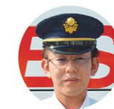
運行管理者 (ダイヤ・運転士の勤務を管理)

お客様から「ありがとう」の言葉をいただいたときに、最も運転士としてのやりがいを感じます。将来の目標は観光バスを運転すること。知識と経験が必要とされる責任の大きい仕事ですが、自分の運転で全国各地へバスを走らせたいと思っています。