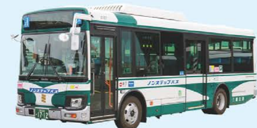
一般路線バス 昭和28年に登場以来、長年三重県民に親しまれているバス

路線バス 路線バスは「地域の足」として、三重県全域を網羅する一般路線バス、三重県内と名古屋・京都等を結ぶ中距離高速バス、首都圏への長距離高速バスを運行しています。