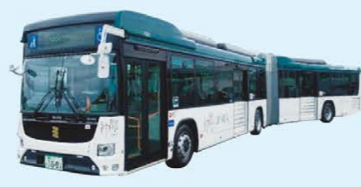
連節バス 全長約18m。利用が多いエリアの通勤時間や伊勢神宮周辺で運行