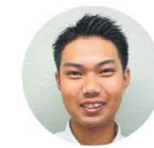
養成運転士 ※運転士になるまでの養成期間

小さい頃から大型車の運転に興味があり養成運転士職として入社しました。養成期間中(約1年間)はバス運賃の精算業務や、出札所で切符販売等をしています。最初はわからないことも多いですが、上司・先輩のフォローも手厚く、働きやすい環境が整っています。早くバス運転士として活躍したいですが、今は自分の出来ることを精一杯していきたいです。