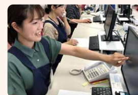
物流の入口を担う受注受付