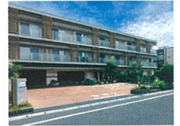
コンシェル舞浜/千葉県