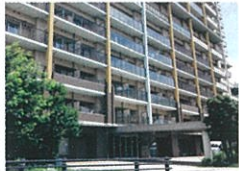
コンシェルささしま/愛知県