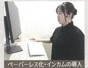
ペーパーレス化・インカムの導入