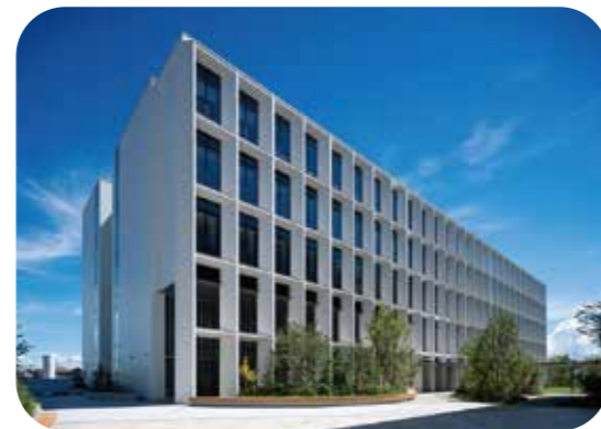
順天堂大学 浦安・日の出キャンパス 2023年竣工