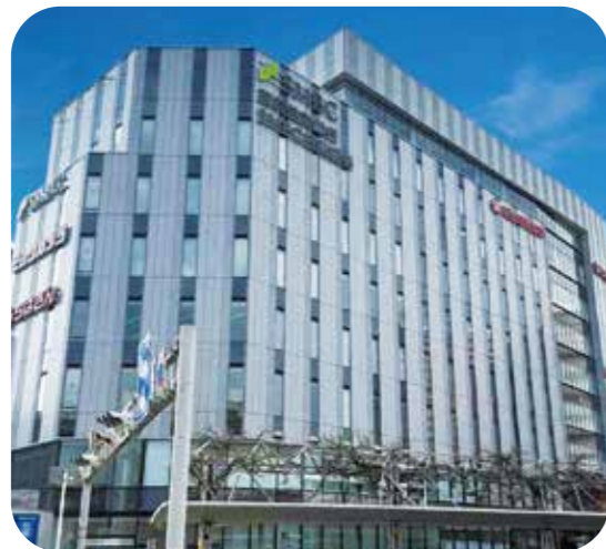
マインズ千葉 2022年竣工