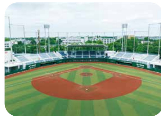
国府台スタジアム 2025年竣工