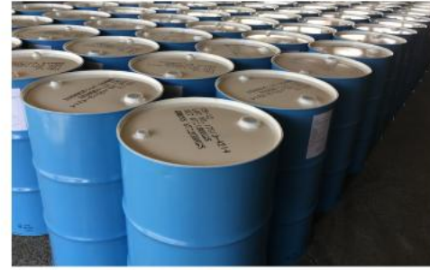
アルコール・溶剤