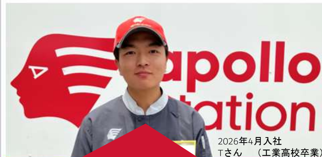
2026年4月入社 Tさん（工業高校卒業）