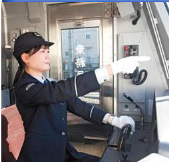
鉄道営業部 乗務員・駅掛員