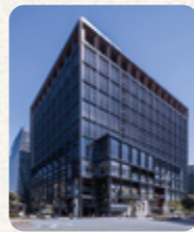
ONE FUKUOKA BLDG.