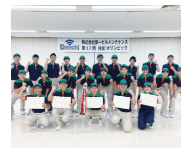
年に1度の技能オリンピック 社員一人ひとりが真剣勝負に挑みます

社内行事や自由参加の同好会が充実。部署の垣根を超えて盛り上がりやすい!仕事上では交流の少ない先輩社員とも仲良くされる機会なので、ぜひ皆さんの参加をお待ちしています。仕事と遊びのメリハリをつけて、社会人生活を一緒に楽しみましょう!