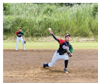
ビルメンテナンス野球大会 3位入賞 チーム一丸で年々順位アップ中