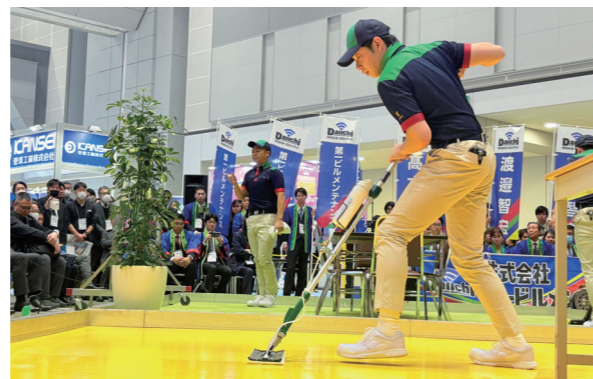
多くの来場者が見守る中 磨き上げた技術で22チームの頂点を