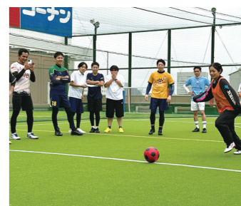
部署・年齢を超えて大熱狂 50人参加のフットサル大会