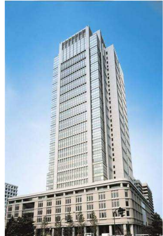
東京本部（通称：丸ビル）

（1984年設立、従業員726名、東北・北海道エリア賃貸住宅完工数21年連続No.1）