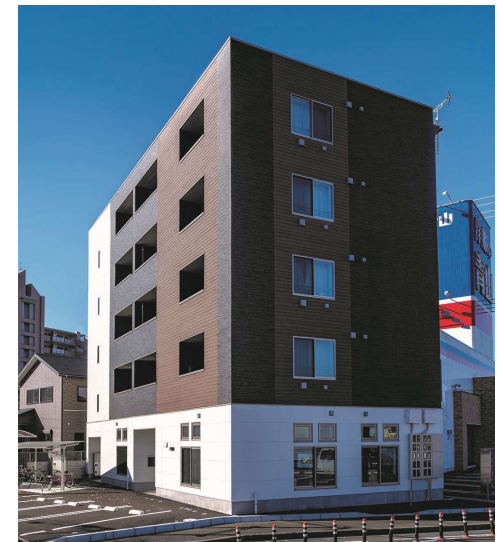
木造5階建て（当社建築）