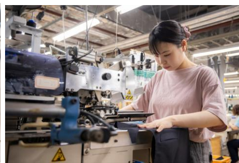
自動ミシンによる縫製作業