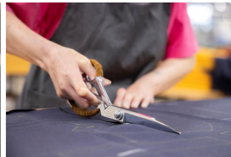
生地のカット作業

工場の中では常時約130人から150の方がそれぞれ自分の役割の作業をおこなっています。 縫製工場の工程は裁断から縫製、プレス作業や検査など様々な作業が存在します。その作業がスムーズにおこなえるように機械設備の準備やメンテナンス、修理をおこなう大切な仕事が当社の保全の仕事です。