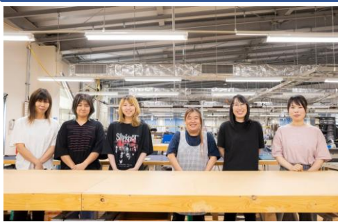
工場内の先輩社員

答え。 当社はオーダースーツ を専門に扱う工場です。 製品になるまでの100 を超えるほぼすべての 工程を工場内で行うこと が出来国内屈指の 縫製工場です。