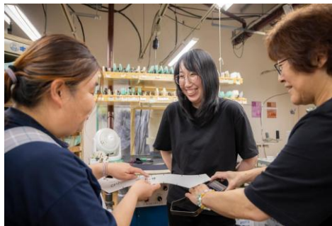
工場内の相談風景